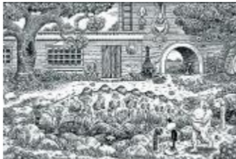
Onirismo en "Poochytown".