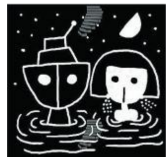
De "Los 154 haikus..."