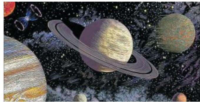
Saturno, reinando en un grabado del Sistema solar.