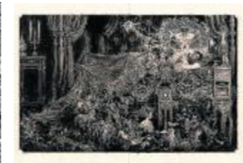
Escalofrío en "El Horla".