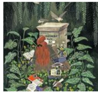
Mary Shelley, niña.